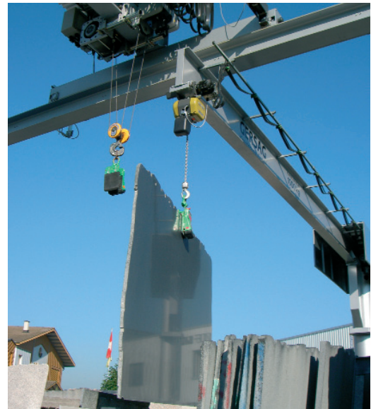
Die Übergabestelle zwischen Brücken- und Schwenkkrane

Die über 100 Sorten Granit mit einem Einstandswert von ca. CHF 600'000.– sind nun systematisch und übersichtlich auf den ca. 1000m 2 angeordnet. Die Lagerfläche wird nun optimal genutzt, einfach bewirtschaftet und das Material kann gleichzeitig, in der als Steingarten angelegten Anlage, den Kunden vorteilhaft präsentiert werden.