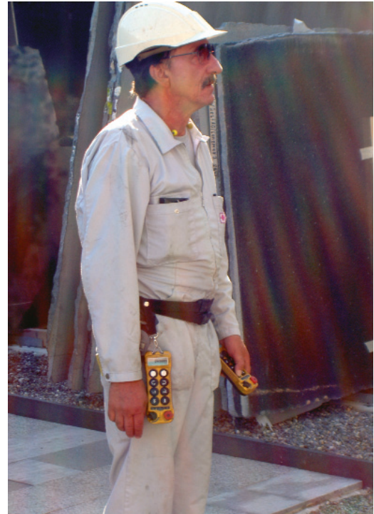
Sichere Bedienung per Funkfernsteuerung

Mit Kranen, statt wie früher mit dem Stapler, kann das Granitplatten-Aussenlager der Firma Fliesag wirtschaftlicher betrieben werden. Die Anlage wird den besonderen behördlichen Auflagen ebenso gerecht, wie der Stufe im Gelände und der L-Form des Lagerplatzes. Im vorliegenden Projekt hatte der Kunde zudem den Vorteil von nur einem Ansprechpartner für die Stahlkonstruktion, für die Kranbahn wie auch für die Krane selbst. Ein Service-Trupp der GERSAG, der innert Stunden Probleme behebt, sorgt für eine reibungslose und unterbruchsfreie Nutzung der Krane.