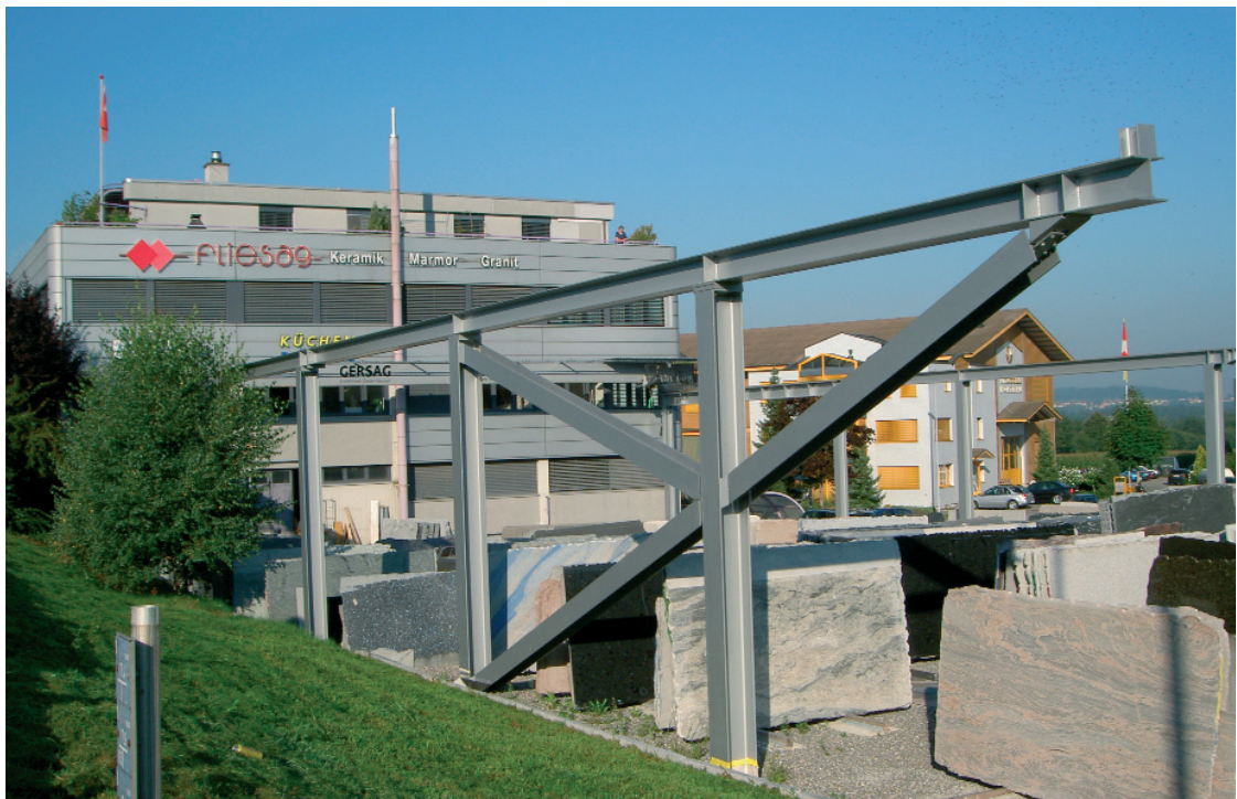
Aussenlager mit Kranen bei der Firma Fliesag AG

Um die Bewirtschaftung des Granitplatten-Aussenlagers zu optimieren, hat sich die Firma Fliesag AG in Schenkon für Aussenkrane der GERSAG Krantechnik GmbH entschieden. Mit zwei Kranen - einem Einträger-Brückenkran und einem Schwenkkrane - kann das Material auf dem gesamten Lagerplatz schneller und mit weniger Ressourcen bewegt werden.