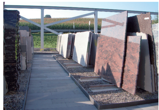
Aussenlager als Steingarten

Auch in der Schweiz gibt es immer wieder tödliche Unfälle bei der Verschiebung von Steinplatten. Der Unsicherheitsfaktor sind unsichtbare Risse im Material, so dass nicht ausgeschlossen werden kann, dass beim Transport mal eine Platte herunter fällt. Um hier die höchstmögliche Sicherheit zu bieten und Gefahren vorzubeugen wurden die Krane mit Funkfernsteuerungen ausgestattet. Mit dieser Lösung kann der Bediener immer auf «Nummer Sicher» gehen und aus der Distanz zu navigieren.