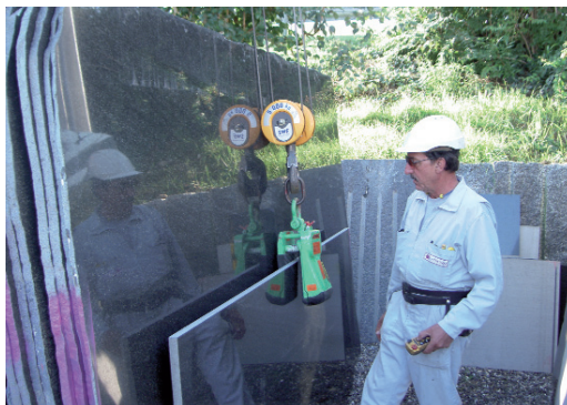
Handling der Granitplatten

Bis zum Kauf des Grundstückes war das Lager auf mehrere Stellen um das Gebäude herum verteilt. Die Verschiebung der bis zu drei Meter breiten Granit-Platten erfolgte per Gabelstapler, was einerseits gefährlich war und andererseits immer zwei Personen absorbierte. Zusätzlich, waren besonders breite Wege notwendig, was eine enorme Lagerplatzverschwendung bedeutete.